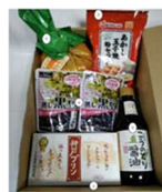
▲ 令和2年度 特産品詰め合わせ例

●「初代県庁復元等応援プロジェクト」については 兵庫県企画県民部 地域創生局 兵庫津ミュージアム整備室 TEL: 078-362-4004 FAX: 078-362-3950 Email: chiikishigen@pref.hyogo.lg.jp